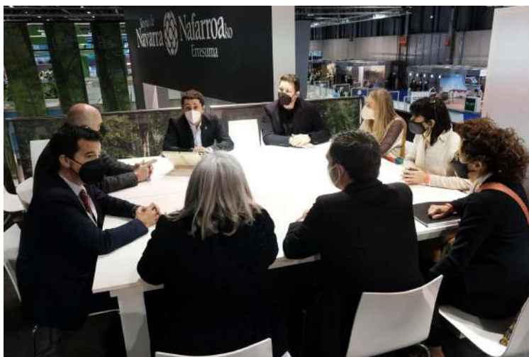
Una de las reuniones de trabajo presididas por el consejero Irujo.