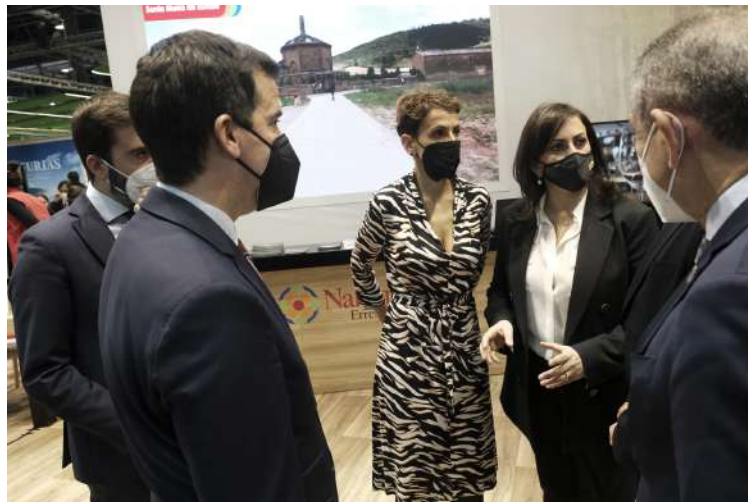
Las autoridades navarras atienden las explicaciones de una de las responsables del stand.