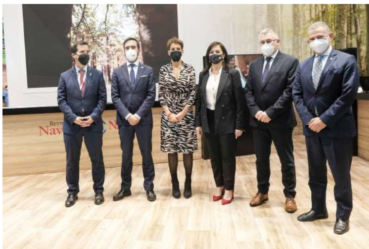
La Presidenta acudió a visitar el stand instalado por Navarra.